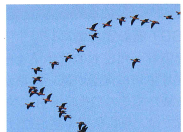
※各月の異名を集め、代表的なものの由来を説明します。