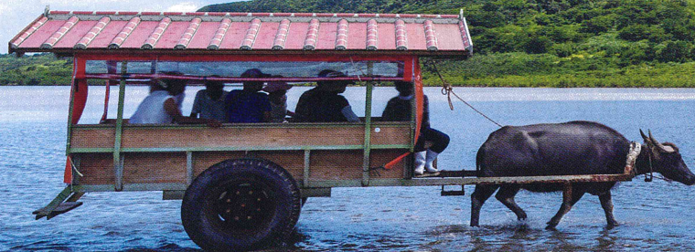
西表島 由布島の水牛車