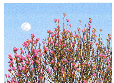
※各月の異名を集め、代表的なものの由来を説明します。

…まだ寒さが残り、衣を重ね着ることから「衣更着（きさらぎ）」が転じた説、草木が芽吹き、更生する時季だから「生更（きさら）ぎ」の意とする説など、諸説あります。なお、如月の漢字が当てられるのは、中国の2月の異名「如月（じょげつ）」が由来のようです。（他の異名）梅見月（うめみづき）、雪消月（ゆきぎえづき）、仲春（ちゅうしゅん）、恵風（けいふう）など。